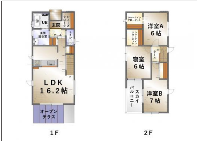
写真 パースはイメージです。現状を優先します。